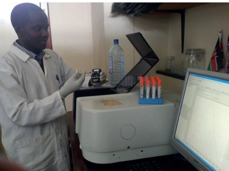
Лаборант анализирует пробы дейтерия в лаборатории инфракрасного спектрометра с преобразованием Фурье в Кении.