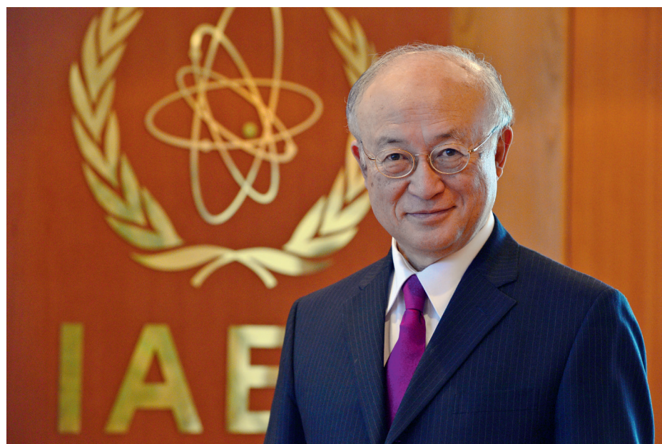
Yukiya Amano (Japon), cinquième et actuel Directeur général de l'AIEA, depuis 2009.