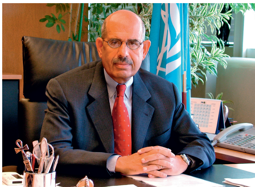
Mohamed ElBaradei (Égypte), quatrième Directeur général de l'AIEA, de 1997 à 2009.