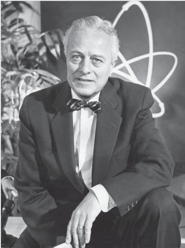
كان ستيرلينغ كول، من الولايات المتحدة الأمريكية، أول مدير عام للوكالة. وقد ترأس الوكالة خلال سنوات نشأتها الأولى، من عام ١٩٥٧ إلى عام ١٩٦١.