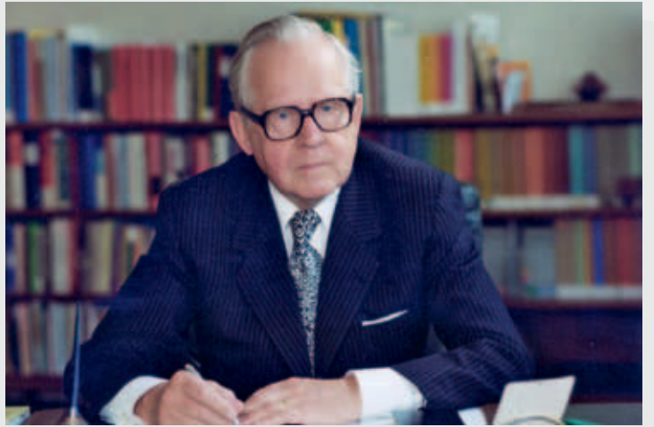
كان سيغفارد إكلوند، العالم السويدي المتميز، المدير العام الثاني للوكالة، من عام ١٩٦١ إلى عام ١٩٨١.