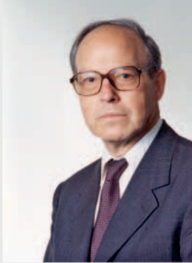
كان هانز بليكس، من السويد، المدير العام الثالث للوكالة، من عام ١٩٨١ إلى عام ١٩٩٧.