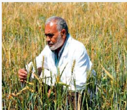
(图/粮农组织/国际原子能机构)