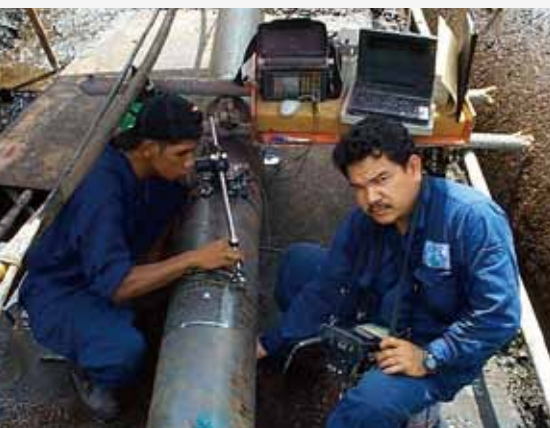
(图/迈达尼无损检验培训中心A. Nassir Ibrahim)

核科学，包括核动力，在减缓和适应气候变化方面能起到显著作用。核电与风电水电一样，是可用于发电的最低碳技术之一。原子能机构致力于提高全球对核电在气