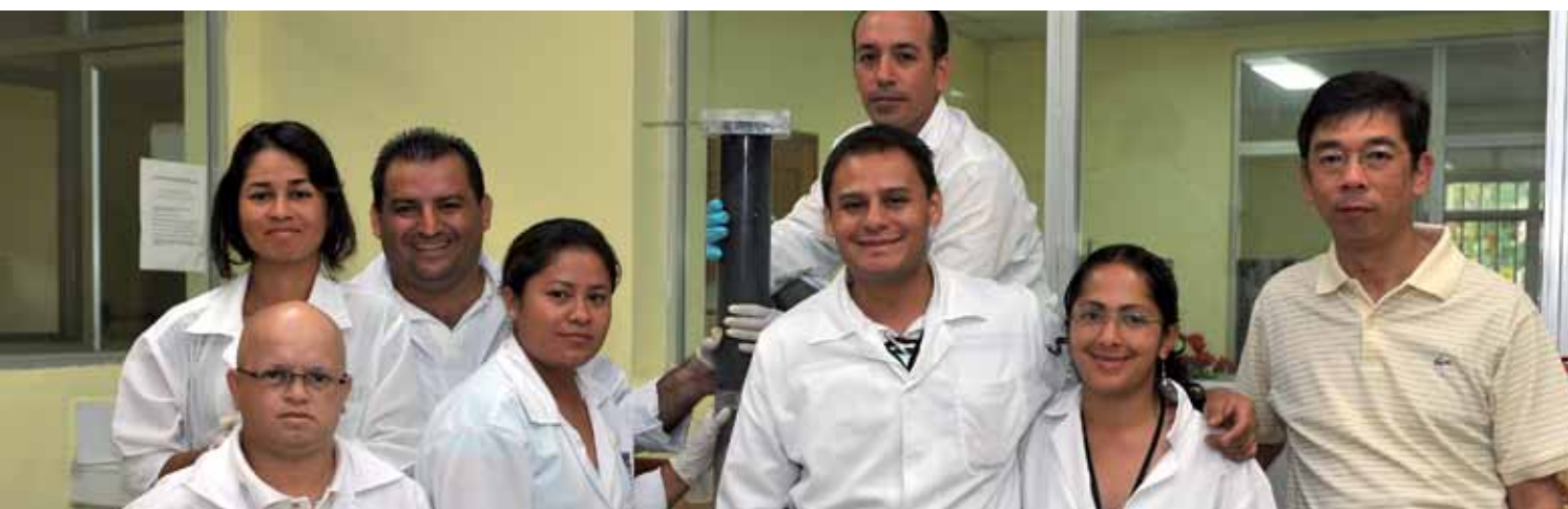
14 Проект по борьбе с загрязнением в Карибском бассейне, также известный как RLA/7/012, обеспечил создание в регионе сети, состоящей из талантливых специалистов, учреждений и лабораторий, активно обменивающихся информацией, ресурсами и возможностями.

Текст: Р. Кевенко • Оформление: Р. Кенн