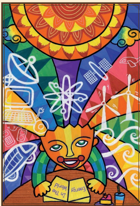
2-я премия: Энергия в понимании ребенка

“На этом рисунке я нарисовал все виды энергии на Земле. Поэтому я нарисовал земной шар и на нем много энергии. Из Земли растет оливковое дерево в форме сердца. На этом оливковом дереве много людей, которые используют земную энергию, например, в кондиционерах, автобусах, телефонах, солнечных батареях, лифтах, эскалаторах и ветряках. А в нижней части Земли - люди из разных стран. Это означает, что все мы должны любить нашу земную энергию, а иначе больше не будет энергии, которую можно использовать”.