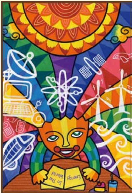
2 e prix: L'énergie dans l'esprit d'un enfant

«J'ai dessiné tous les types d'énergie qu'on trouve sur la Terre. J'ai donc dessiné une Terre avec plein d'énergie dessus. Il y a un olivier qui pousse comme un cœur au-dessus de la Terre. Dans cet olivier, il y a beaucoup de gens qui utilisaient l'énergie de la Terre, comme des climatiseurs, des bus, le téléphone, un panneau solaire, un ascenseur, un escalator et une éolienne. Et en bas de la Terre, ils étaient tous de pays différents. Ça veut dire que nous devons tous aimer l'énergie de notre Terre, sinon, il n'y en aura plus à utiliser.»