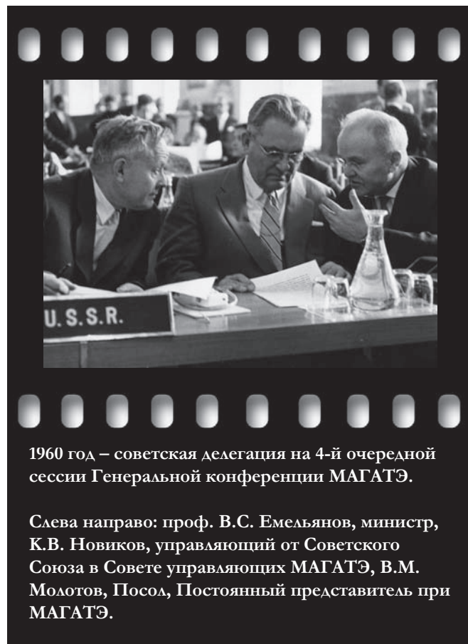
1960 год — советская делегация на 4-й очередной сессии Генеральной конференции МАГАТЭ.

Моя роль столь незначительна, что я не думаю, чтобы это было проблемой! На самом деле я с оптимизмом смотрю в будущее, поскольку полагаю, что молодое поколение сможет справиться с любыми задачами. Мне кажется, что молодое поколение может сделать довольно много. Они быстро работают. Они быстро усваивают. Они быстрее предлагают идеи. Поэтому, несмотря на сегодняшний общий пессимизм, я являюсь оптимистом и считаю, что завтрашние лидеры обеспечат настоящее лидерство, позволяющее удовлетворить потребности общества.