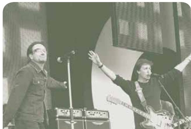
Боно из группы "U2" и сэр Пол Маккартни на концерте "Live 8", состоявшемся 2 июля 2005 года в лондонском Гайд-парке.

Я уже говорил о том, что ежедневно 6500 африканцев умирают от такой болезни, как СПИД, заражение которой можно предотвратить: в Малави я видел своими глазами людей, по трое лежавших на одной койке и ждавших своей очереди умереть. Это есть африканский кризис. Но тот факт, что мы в Европе и Америке не считаем это чрезвычайной ситуацией, и тот факт, что об этом не рассказывают ежедневно в новостях, — это наш кризис.