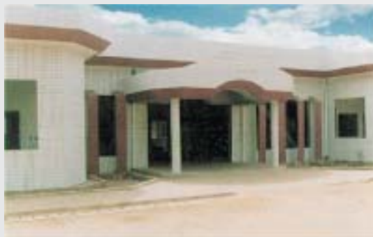
Фото: Главный вход в отделение радиотерапии больницы Корле-Бу в Аккре сразу после постройки в 1996 г., до того как появились трава, клумбы, большие ящерицы и пациенты.

В 1993 г. МАГАТЭ приступило к осуществлению проекта организации услуг радиотерапии в Гане, стране с 14-миллионным населением. В Гане не существовало онкологического реестра; публиковалась лишь скудная информация о раке. Тем не менее, согласно показателям, рассчитанным при содействии отделений ВОЗ в Женеве и Лионе на основании численности населения, число людей, ежегодно заболевающих раком в Гане, составляло более 10 тыс. Кроме того, соседние страны, Кот-д'Ивуар, Буркина-Фасо и Того, также не располагают соответствующим оборудованием для лечения. Проект получил значительную поддержку со стороны жены президента г-жи Ролингс, а также Министерства здравоохранения,