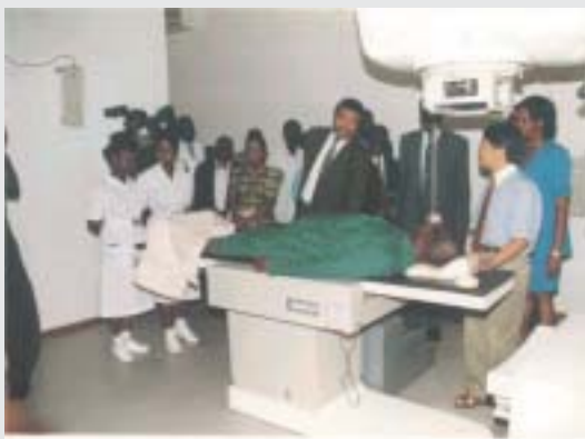
Фото: Президент Ролингс (в центре) около установки кобальт-терапии с больным, лечение которого проводит д-р Ву Жиньдэн (справа), на официальном открытии установки в Гане.

Этому отделению продолжает оказываться помощь. Ведется монтаж ортовольтной установки для лечения неглубоко залегающих опухолей, предусмотренной в первоначальном плане, — не только для соответствия особым требованиям некоторых видов терапии, но также для того, чтобы уменьшить приходившееся на единственную кобальтовую установку число больных, которое сейчас превосходит ее потенциал. Вместе с Международным агентством по изучению рака (МАИР) МАГАТЭ также участвует в создании национального онкологического реестра, в который войдет информация, необходимая для рационального расширения этих услуг.