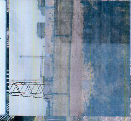
В 18.07 12 марта 2024 г. зафиксирован взрыв в районе базисного склада дизельного топлива Запорожской АЭС