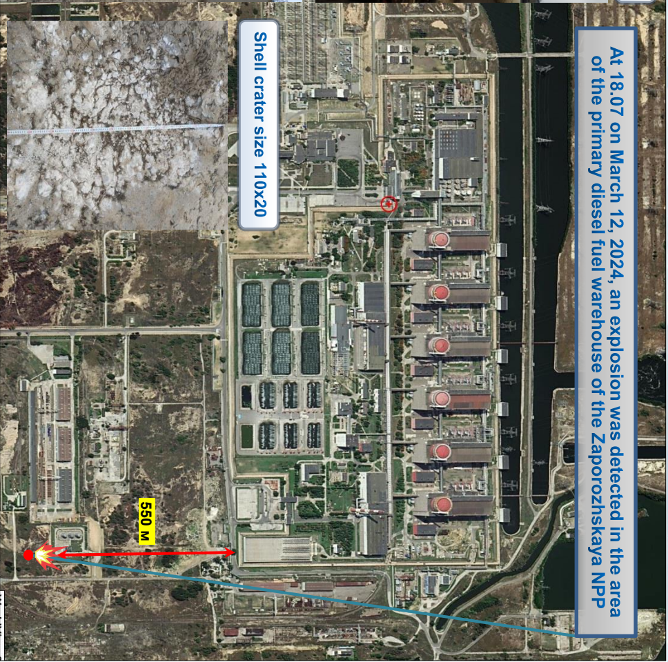
Shell crater size 110x20

At 18.07 on March 12, 2024, an explosion was detected in the area of the primary diesel fuel warehouse of the Zaporozhskaya NPP