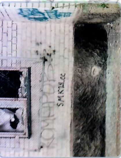
4.11.2023 г. один удар БПЛА по зданию жилого дома по адресу: ул. Набережная, д. 24