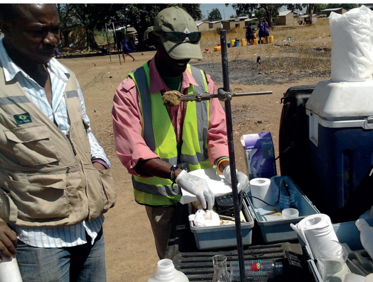
Подготовка пробы подземной воды к анализу на содержание трития, лаборатория изотопной гидрологии, Комиссия по атомной энергии Ганы.