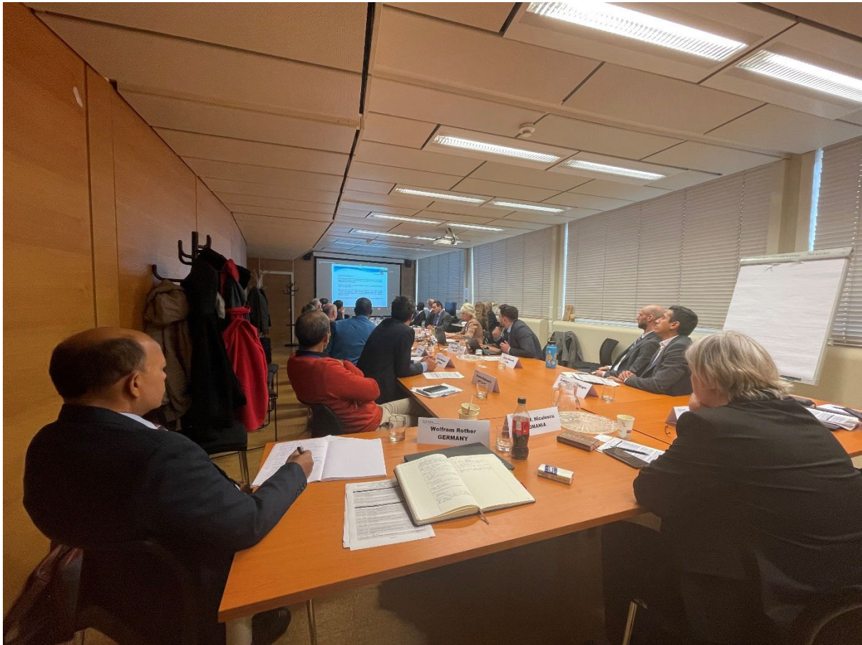
الاجتماع التقني بشأن المفاعلات النمطية الصغيرة، فيينا، آذار/مارس 2023.