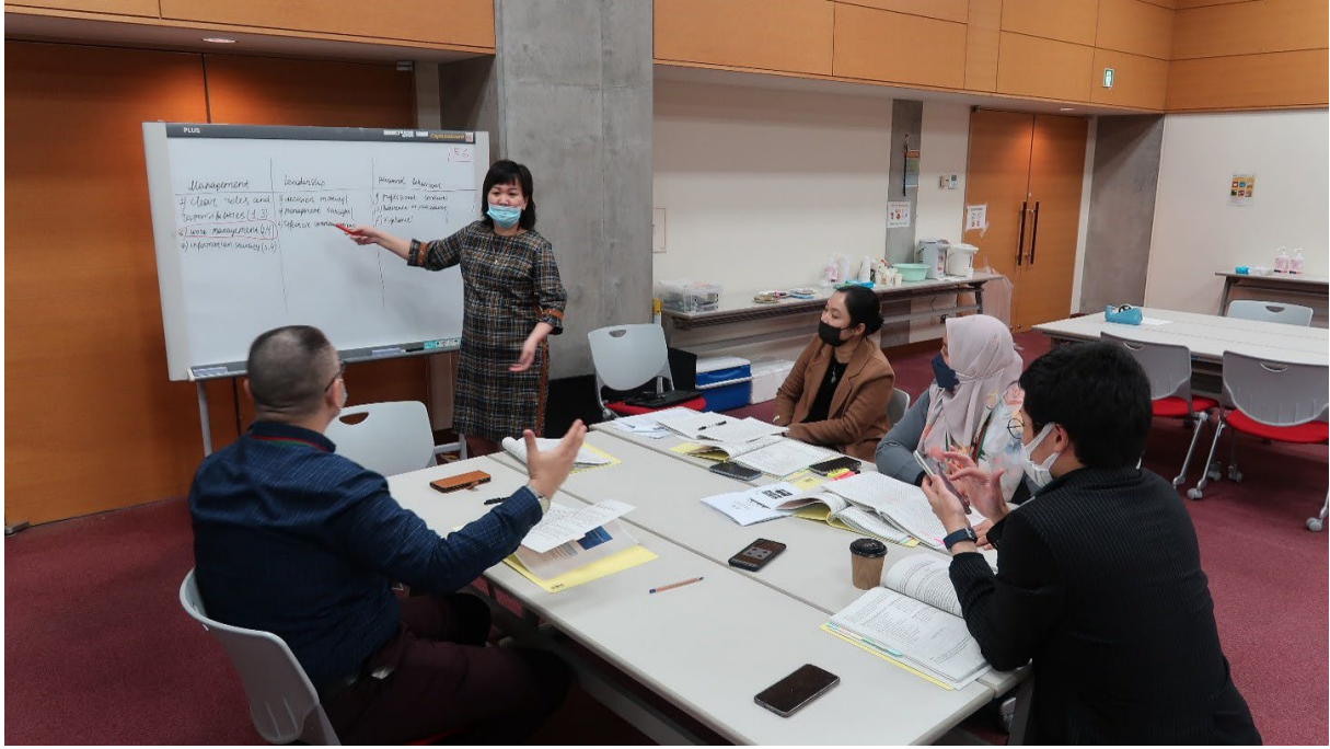
حلقة عمل إقليمية حول ثقافة الأمن النووي في الممارسة العملية، طوكاي، اليابان، شباط/فبراير - آذار/مارس 2023

30- نظّمت الوكالة حلقتي عمل وطنيتين حول ثقافة الأمن النووي عملياً - في كيغالي في تشرين الأول/أكتوبر 2022 وفي أبيدجان، كوت ديفوار في آذار/مارس 2023. كما نظّمت الوكالة حلقتي عمل إقليميتين حول الممارسة العملية بشأن ثقافة الأمن النووي عملياً- في لوساكا في تشرين الأول/أكتوبر 2022 (للبلدان الأفريقية الناطقة بالإنكليزية والفرنسية) وفي توکاي باليابان في الفترة من شباط/فبراير إلى آذار/مارس 2023 - وحلقة عمل دولية واحدة حول ثقافة الأمن النووي- عملياً، في بهادورجاره، الهند في أيلول/سبتمبر 2022. 29