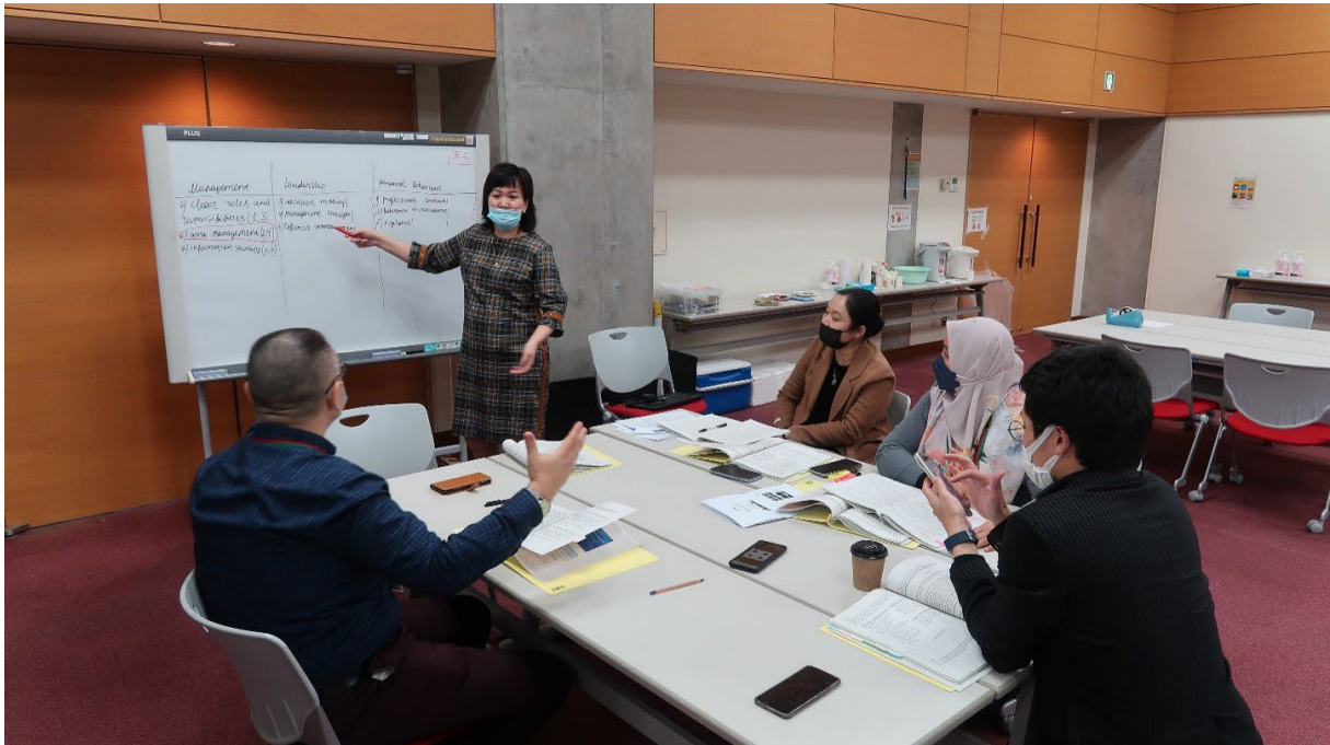
2023年2月至3月在日本东海举办的核安保文化实践地区讲习班。

30. 原子能机构于2022年10月在基加利和2023年3月在科特迪瓦阿比让举办了两次核安保文化实践国家讲习班。原子能机构还于2022年10月在卢萨卡（针对非洲英语和法语国家）和2023年2月至3月在日本东海举办了两次核安保文化实践地区讲习班，并于2022年9月在印度巴哈杜尔格尔举办了一次核安保文化实践国际讲习班。 29