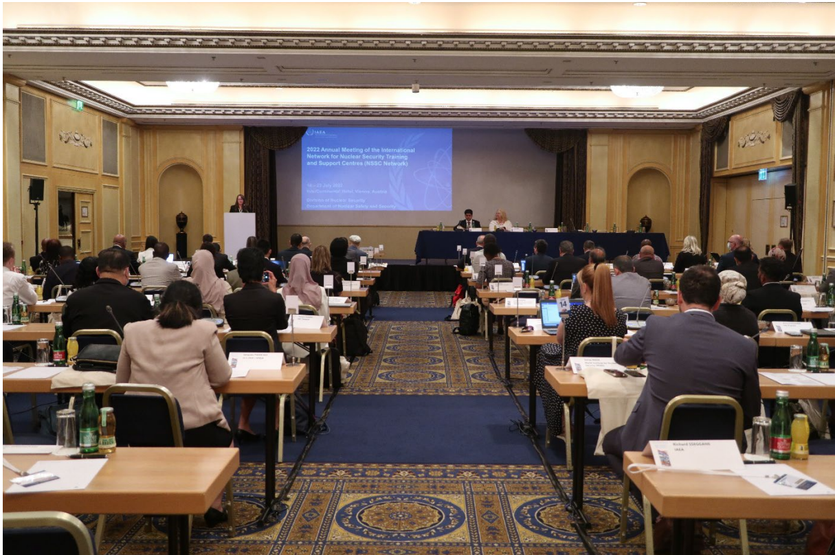
2022 年 7 月在维也纳举行的国际核安保培训和支持中心网年度会议。

32. 在报告所涉期间，翻译并以阿拉伯文、中文、英文、法文、俄文和西班牙文提供了两个电子学习模块，同时开发了两个题为“核安保文化入门”和“核安保侦查架构认识”的新模块，使电子学习模块总数达到 21 个，其中 19 个以上述语文版本提供。 31