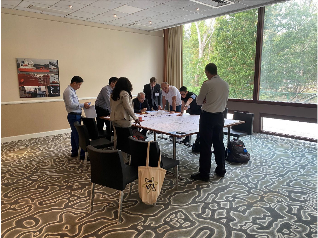
2022年9月在比利时举行的关于内部威胁的预防和保护措施的从业人员高级培训班的从业人员高级培训班。

56. 原子能机构提供了事件和贩卖数据库季度分析简要报告，印发了汇总事件和贩卖数据库事件以供公众宣传的年度概览，并响应成员国请求提供了其他信息服务，以支持三次大型公共活动。 55