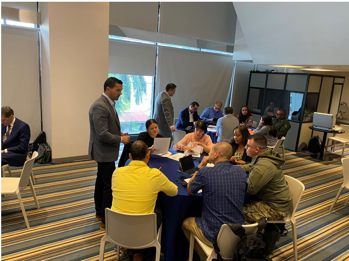
2022年10月在巴拿马城举办的“核安保综合支助计划”地区讲习班。

42. 原子能机构继续协助全球努力建立有效和可持续的国家核安保制度，包括设定相关国际法律文书规定的义务。“核安保综合支助计划”工作组访问和针对高级官员的提升认识工作组访问是原子能机构用于这些努力的关键工具。 41