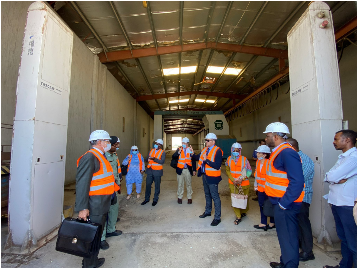
2022 年 12 月对苏丹进行的国际核安保咨询服务工作组访问。