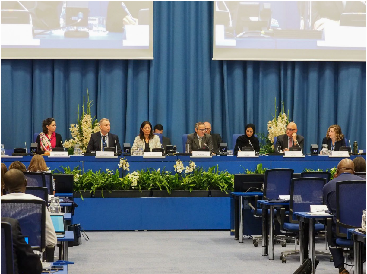
2023年5月，放射源专家汇聚维也纳，讨论 原子能机构《放射源安全和安保行为准则》的实施进展情况。

49. 原子能机构处理了四项与加强使用和贮存高活度放射源的设施的实物保护有关的请求。原子能机构协助从两个国家移除了 18 个高活度弃用放射源，继续支持七个国家正在实施的对 35 个高活度弃用放射源的移除，并启动了从四个国家移除另外 42 个放射源的准备工作。 48