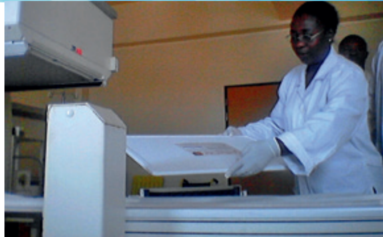
Une physicienne médicale mesure l'uniformité des images d'une gamma-caméra dans le cadre du processus d'assurance de la qualité.

Les physiciens médicaux sont des professionnels de santé qui ont suivi un cursus universitaire spécialisé et une formation clinique aux concepts et techniques qui régissent l'application de la physique en médecine. Ils disposent donc des compétences requises pour veiller à la sûreté et à l'efficacité pour les patients de