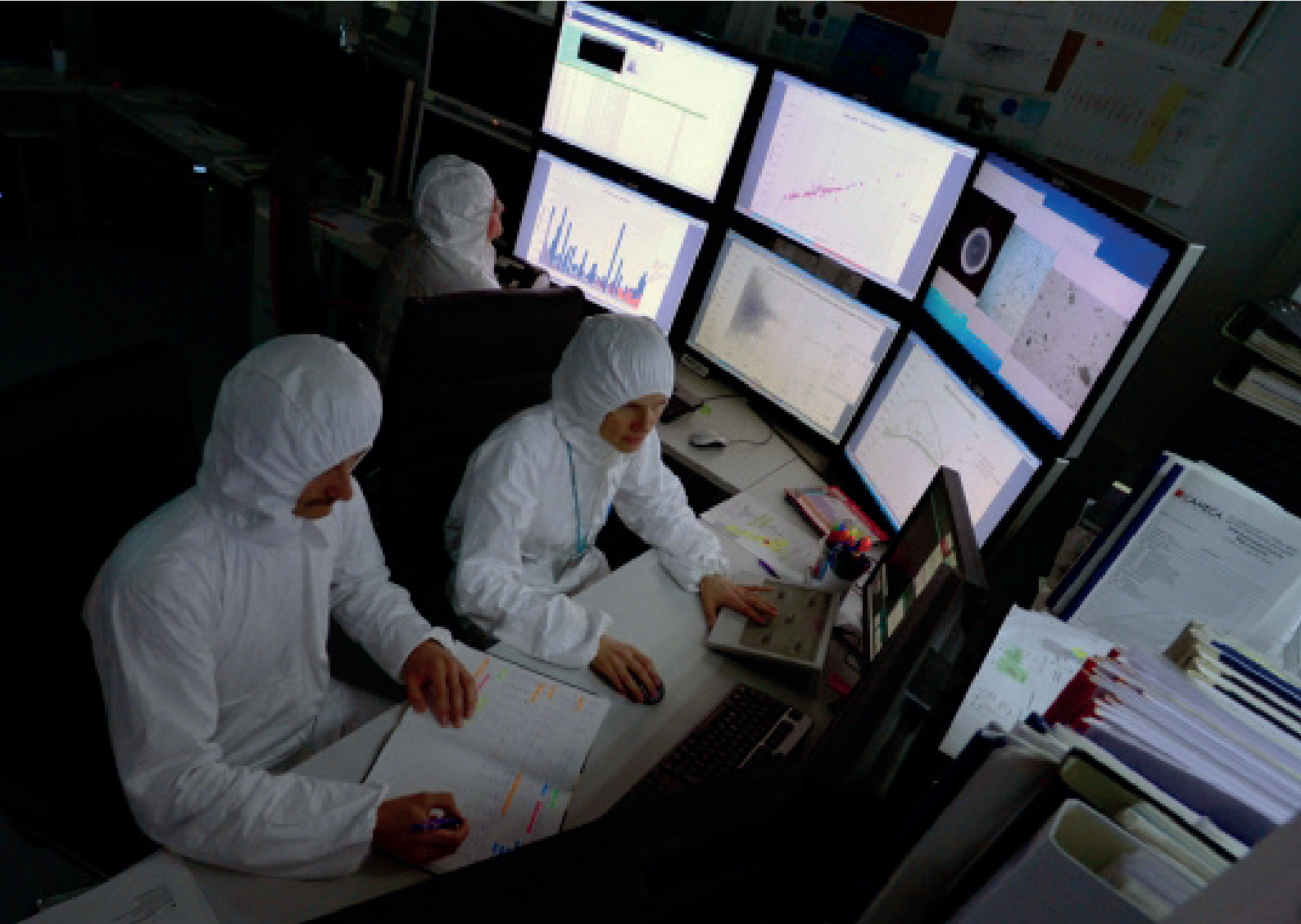
Laboratorio de Muestras Ambientales de Salvaguardias del OIEA en Seibersdorf (Austria).