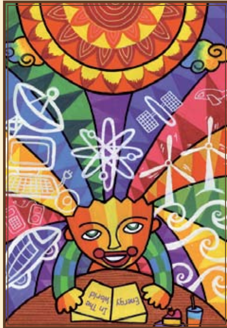
二等奖：孩子脑海中的能源

“我的这幅画是关于地球上的各种能源。所以，我画了一个有很多能源的地球。在地球上长了一棵心型橄榄树，有很多人正在树中使用地球能源，例如空调、公共汽车、电话、太阳能系统、电梯、扶梯，还有风车。在地球底部，是来自不同国家的人们。意思是我们都必须热爱地球能源，否则就不再有能源可用了。”