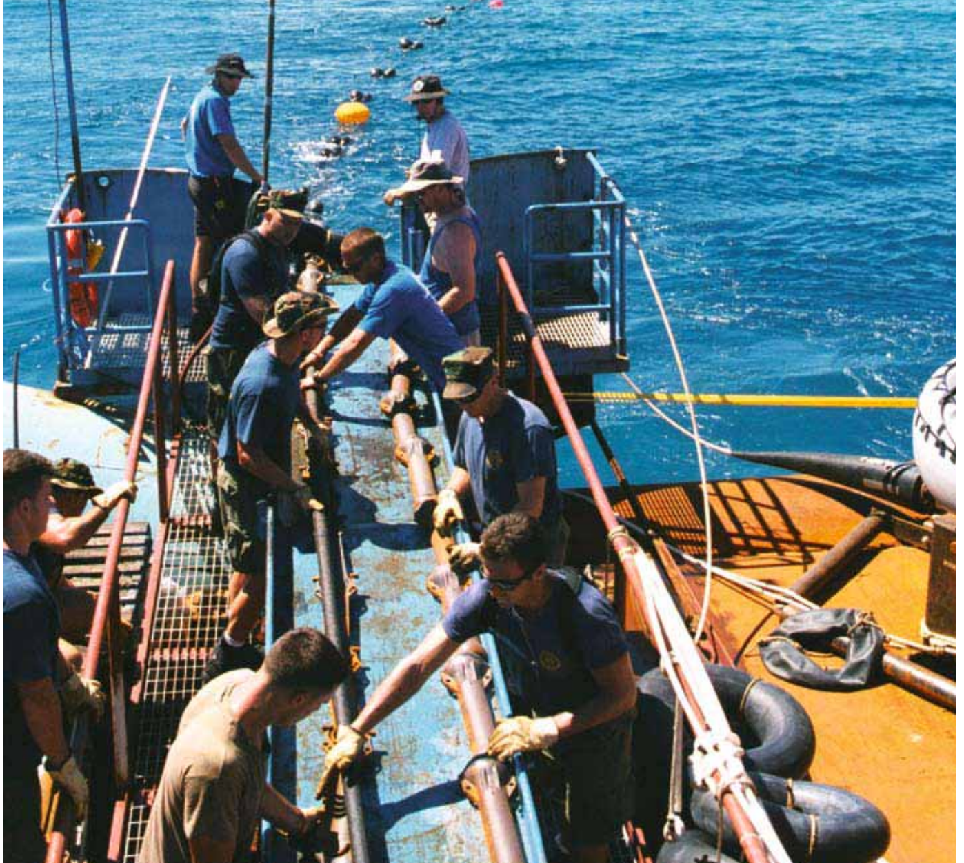
甲板上的一组人员在安装设在海洋中的水声监测站。

创造综合通报系统。此外，还需要提高分析方法的效率，以在所有监测站开始报告数据时能够处理随之增加的数据流量。