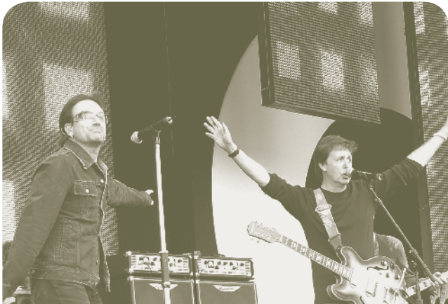
”بونو“ والسيد ”بول ماكارتي“ من فريق U2 في الحفلة الموسيقية الثامنة المباشرة التي أقيمت في حديقة الهاید بارك بلندن في ٢ يوليو ٢٠٠٥.

ولقد أشرت من قبل إلى أن ٦٥٠٠ من الأفارقة يموتون يوميا بسبب مرض يمكن الوقاية منه وعلاجه مثل مرض الإيدز: لقد شاهدت أناسا يصطفون انتظارا للموت، ثلاثة منهم في أحد الأسر في مالاوي. تلك هي الأزمة في أفريقيا. ولكن حقيقة أننا في أوروبا وأمريكا لا نتعامل مع هذه المشكلة كحالة طارئة - ولأنها ليست ضمن الأخبار اليومية، فقد يكون ذلك هو لب مشكلتنا نحن.