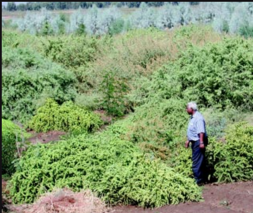
在代尔祖尔考察劳动果实，那里农田一度成为不毛之地。