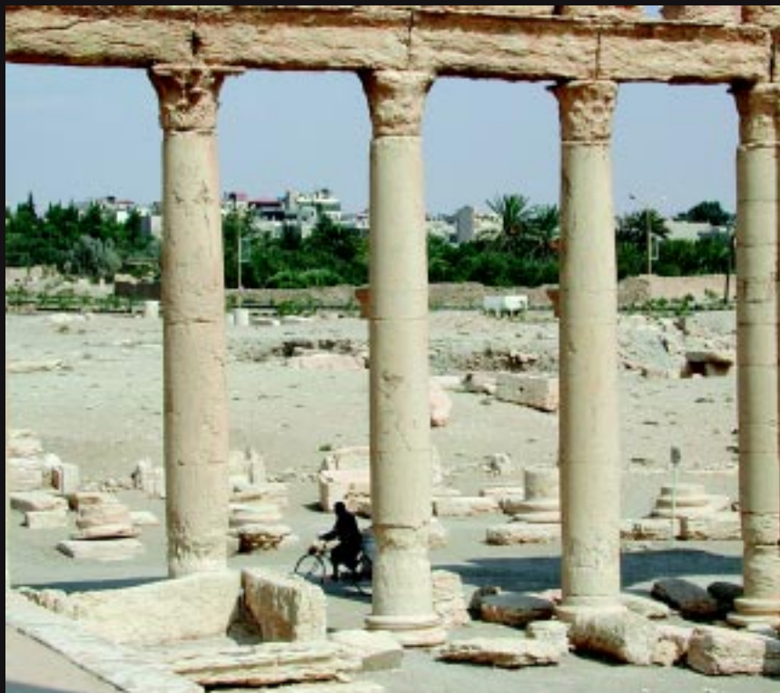
叙利亚经济扎根于农田，如帕尔迈拉古绿洲城市附近和幼发拉底河西岸的那些农田。