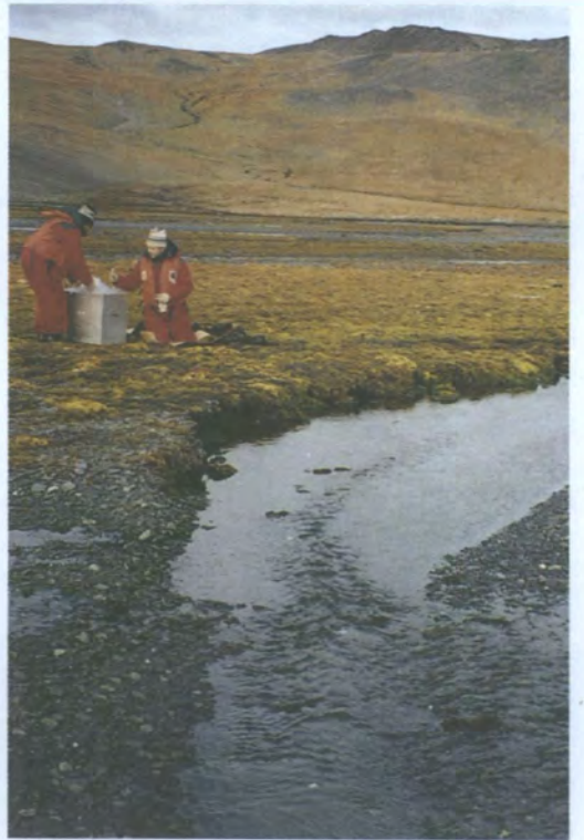
IAEA-MEL 的科学家已经参加了 4 次巡航考察，调查喀拉海中的放射学情况。考察有时是在恶劣的海洋条件下进行的。这些科学家除了采集新地岛上的土壤样品外，还采集喀拉海水体中的生物群样品和其他样品。