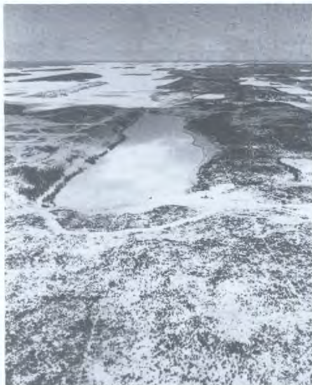
В районе озера Сигар в Канаде расположено крупное месторождение урана, открытое в 1983 г.

После аварии 1986 г. на Чернобыльской АЭС в Советском Союзе Швеция была первой страной на Западе, подавшей сигнал тревоги. Специалисты Национального института радиационной защиты, обладавшие необходимыми знаниями работы на соответствующих установках и опытом групповой работы, задействовали гамма-спектрометрические аэросистемы Шведской геологической компании. В течение одного дня был переоборудован самолет, с помощью которого были составлены две полные карты распределения радиоактивных выпадений. Их мастерство и навыки проведения аэросъемок, а также опыт подготовки и предоставления геофизических данных сыграли огромную роль и позволили составить полную карту радиоактивного загрязнения, которую получили все жители Швеции. В дополнение к картированию районов радиоактивного загрязнения, которое помогло определить места, тре-