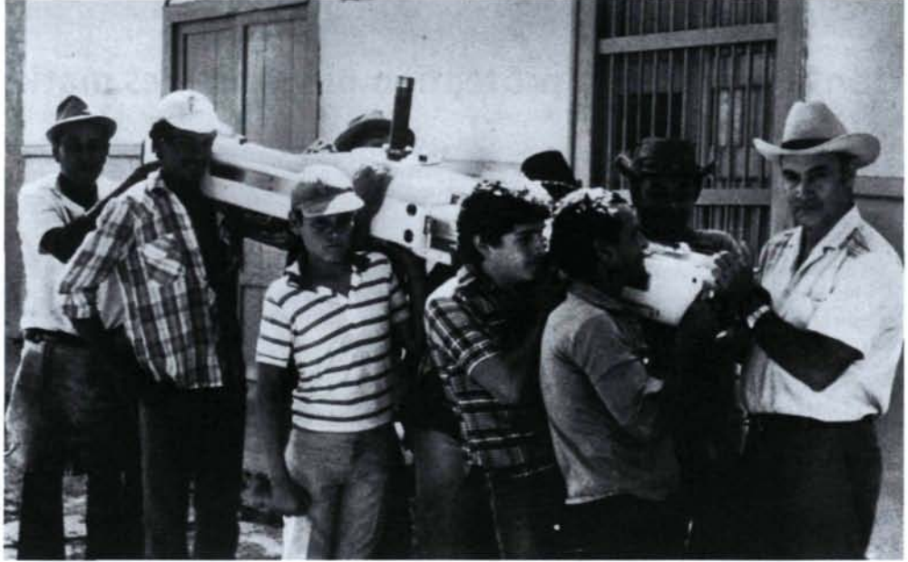
Tout le village de Campamento (Colombie), s'est précipité pour aider au transport de l'équipement radiologique de l'hélicoptère à l'hôpital.

de droite est une reproduction du cliché développé qui devrait être obtenu. Le manuel de technique de chambre noire suit le même principe pas-à-pas.