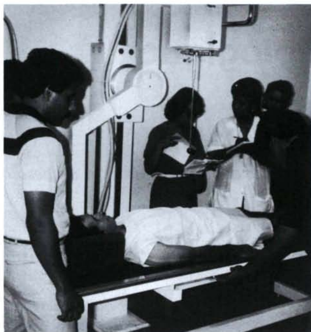
A Castilla (Colombie), le personnel d'un petit hôpital apprend à se servir de la structure radiologique de base. Pour deux ou trois patients à examiner par jour une formation poussée n'est pas nécessaire.

les principaux constructeurs, s'inspirant de ce cahier des charges, ont entrepris la fabrication d'appareils tandis que le groupe consultatif mettait au point un manuel de technique radiographique, un autre pour la technique de chambre noire et un troisième de radiodiagnostic pour le médecin.