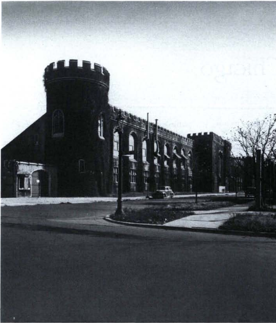
Les West Stands de Stagg Field à l'Université de Chicago. C'est à l'intérieur de ce bâtiment que l'équipe dirigée par Enrico Fermi a construit le premier réacteur nucléaire du monde. Le 2 décembre 1942, à 3 h.25 de l'après-midi, une barre de commande enrobée de cadmium a été retirée du réacteur, déclenchant ainsi la première réaction en chaîne auto-entretenue provoquée par l'homme.

Au moment de mon arrivée à Chicago, plus d'une centaine de travailleurs scientifiques étaient déjà à l'œuvre, dispersés dans les laboratoires de l'université. Une atmosphère excellente régnait dans ce groupe de jeunes techniciens enthousiastes; ils savaient que leur objectif était une arme, qui, en cas de réussite, détiendrait un potentiel de destruction sans commune mesure avec celles du passé. Les scrupules moraux étaient alors étouffés par l'intérêt passionnant des recherches et par la crainte obsédante que les Allemands fussent sur la même voie, peut-être même en avance. Le calendrier envisagé à cette date, et qui devait être miraculeusement respecté, prévoyait la fabrication de la bombe en trois ans.