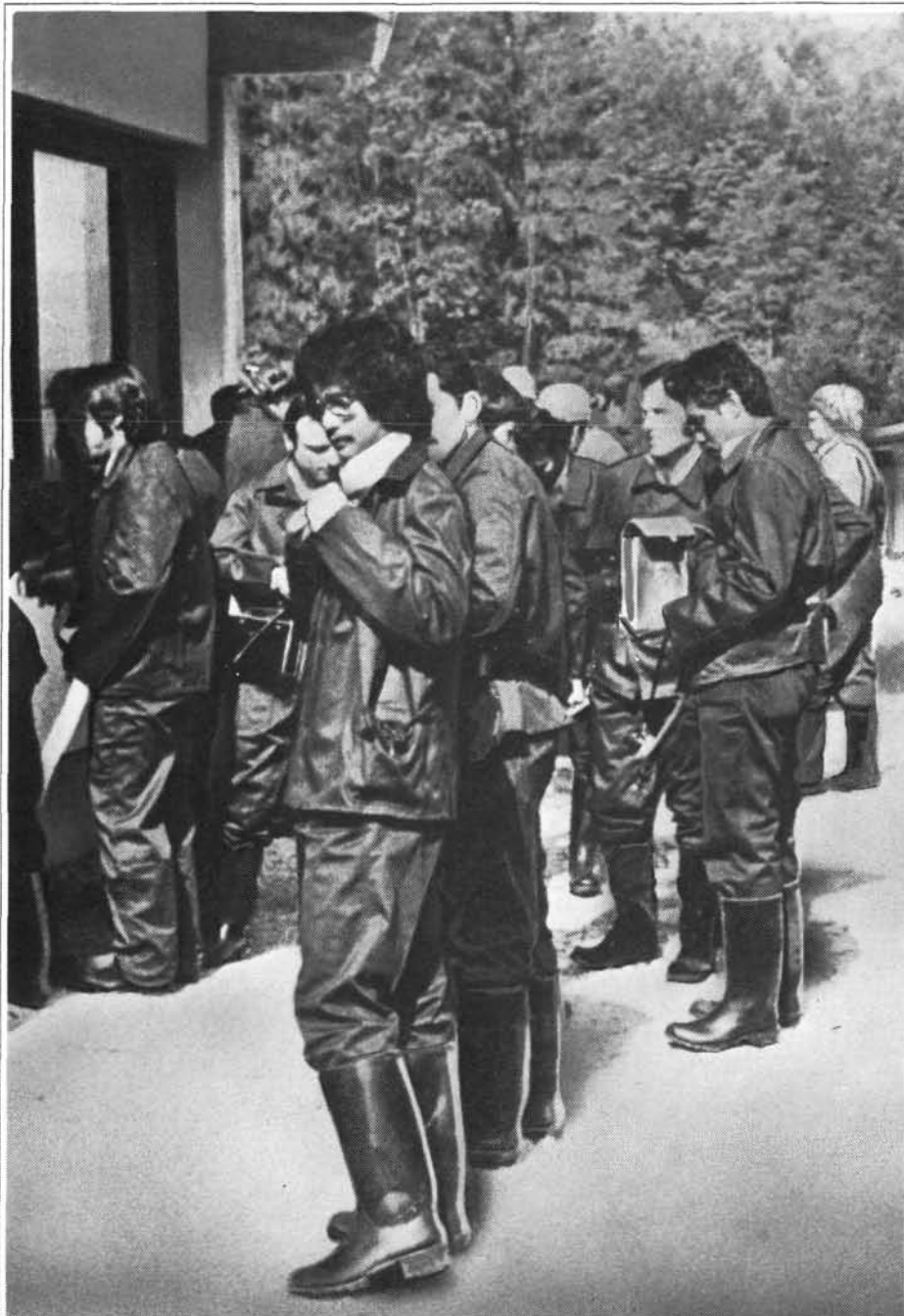
Des participants au cours se préparent à entrer dans la mine d'uranium Zirovski Vrh, en Yougoslavie. Pour beaucoup d'entre eux c'était la première fois qu'ils visitaient une mine d'uranium souterraine.