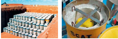
أمثلة عن الممارسات الجيدة

إنّ تبادل المعلومات الذي تعززه الاجتماعات الاستعراضية يمكن أن تستفيد منه بشكل خاص البلدان التي لديها خبرات أقلّ في مجال ضمان أمان التصرف في الوقود المستهلك والنفايات المشعّة.