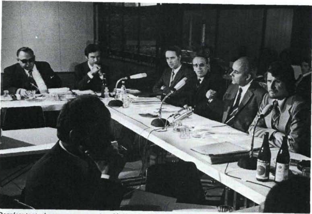
Représentants du gouvernement, dont M. H. Matthöfer, Ministre fédéral de la recherche et de la technologie (deuxième à partir de la droite) et plusieurs membres de son cabinet, lors d'un débat public en République fédérale d'Allemagne.