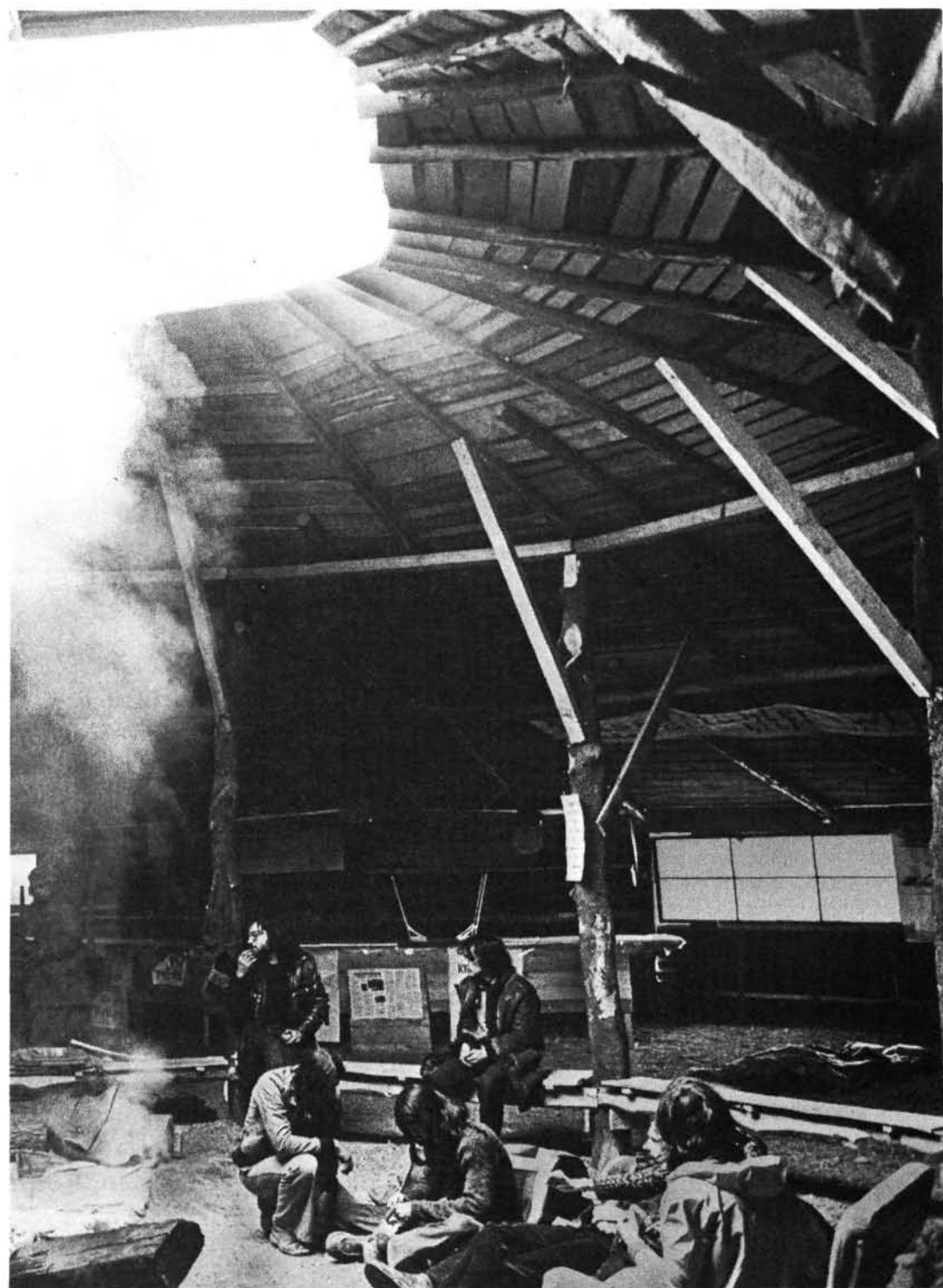
d'Emmendingen dans le sud du Pays de Bade), sont réunis dans leur local appelé "Maison de l'Amitié".