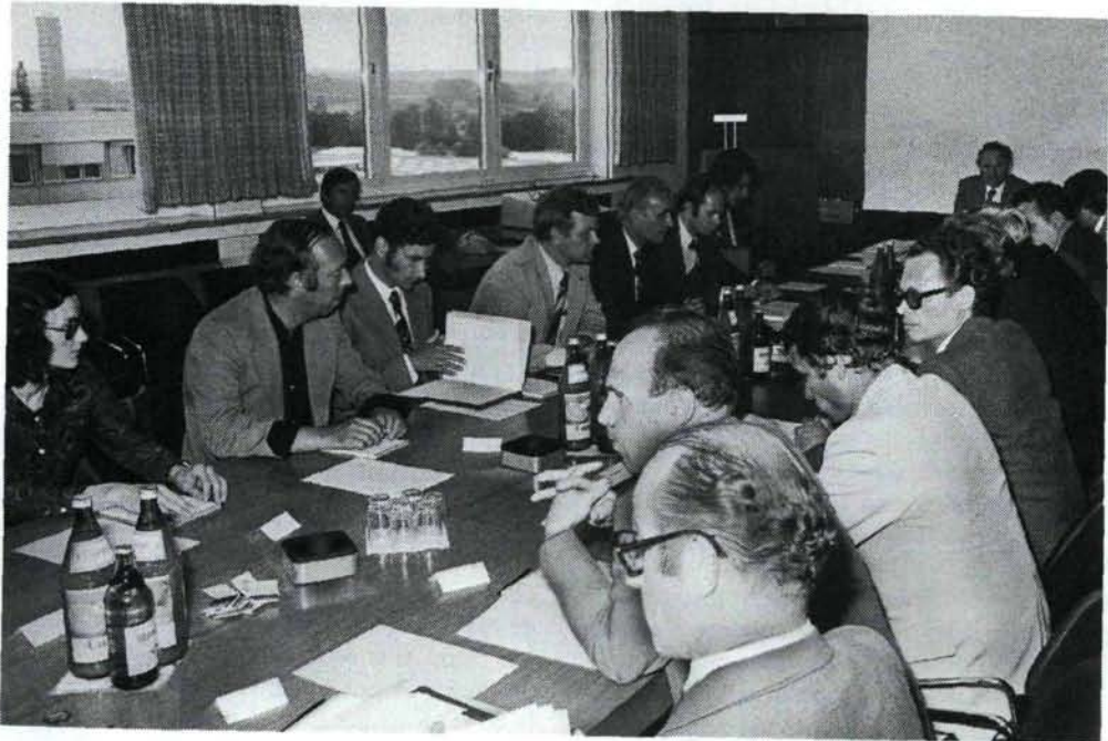
M. H. Matthöfer, Ministre fédéral de la recherche et de la technologie (troisième à partir de la droite, face au public), lors d'un débat public sur la construction d'une centrale nucléaire en République fédérale d'Allemagne.