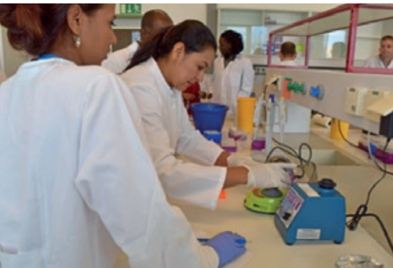
Professionnels formés à la détection du virus Zika dans les laboratoires de l'AIEA à Seibersdorf.

nombre d'activités pour aider les pays touchés à lutter contre les moustiques vecteurs du virus Zika.