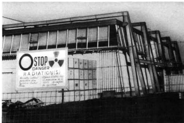
Bloques de cemento apilados en el exterior de un edificio en que se halla instalado un ciclotrón, utilizados como protección contra las radiaciones

todas las enormes posibilidades que ofrece este descubrimiento revolucionario y que sus aplicaciones sean cada vez más frecuentes en centros más pequeños y de inspección más difícil, irán aumentando los riesgos para los trabajadores. Esto obliga a preparar de distinta manera a los trabajadores y a organizar de nuevo el sistema productivo. Todos estos factores aumentan considerablemente las posibilidades de acción de la OIT.