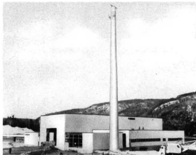
El NPD-2, primer reactor generador de energía del Canadá, cuya construcción está a punto de terminarse

lor industrial de origen nuclear, figuran un elevado factor de utilización, la necesidad de disponer de vapor dentro de ciertas gamas de temperatura, y el encontrarse enclavada a considerable distancia de toda fuente de suministro de combustibles fósiles. Entre las industrias para las que más utilidad tendrá el calor industrial citaron la de la alúmina, la del papel, la de plásticos, la textil, la del cuero, la petroquímica, la del nitrógeno, la farmacéutica y la del caucho.