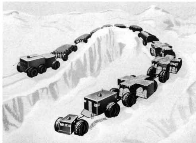
Una futura aplicación de la energía nucleoelectrónica cuyas perspectivas se están estudiando en los Estados Unidos

Más tarde, en un trabajo presentado en una de las sesiones técnicas de la Conferencia, el Sr. de Laboulaye analizó los diversos caminos que podían elegir los países que se encuentran en condiciones económicas distintas, para disminuir los gastos de construcción y de explotación de las centrales nucleoelectrónicas experimentales. Indicó que si un país se caracteriza por un elevado factor de carga, gastos de capital poco cuantiosos y un precio alto para la electricidad suministrada, queda justificada la construcción de una central experimental de gran poten-