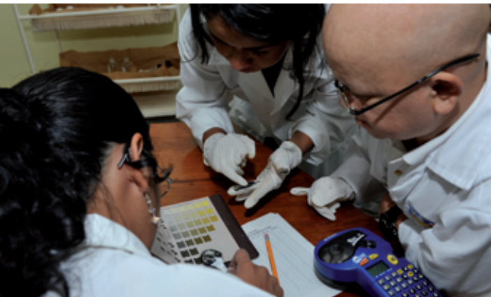
13 A continuación, otros miembros del equipo etiquetan y codifican cada muestra de sedimento en función de su color, textura, olor, etc. Más tarde, se secarán las muestras, a temperatura controlada, en una estufa antes de enviarlas a los laboratorios participantes, que las analizarán atendiendo a diversos parámetros. Proporcionando una importante donación de equipo a laboratorios de los países participantes del Caribe, el OIEA ha ayudado a mejorar la capacidad técnica y analítica de la región en lo relativo a la utilización de técnicas nucleares para estudiar la contaminación de las costas.