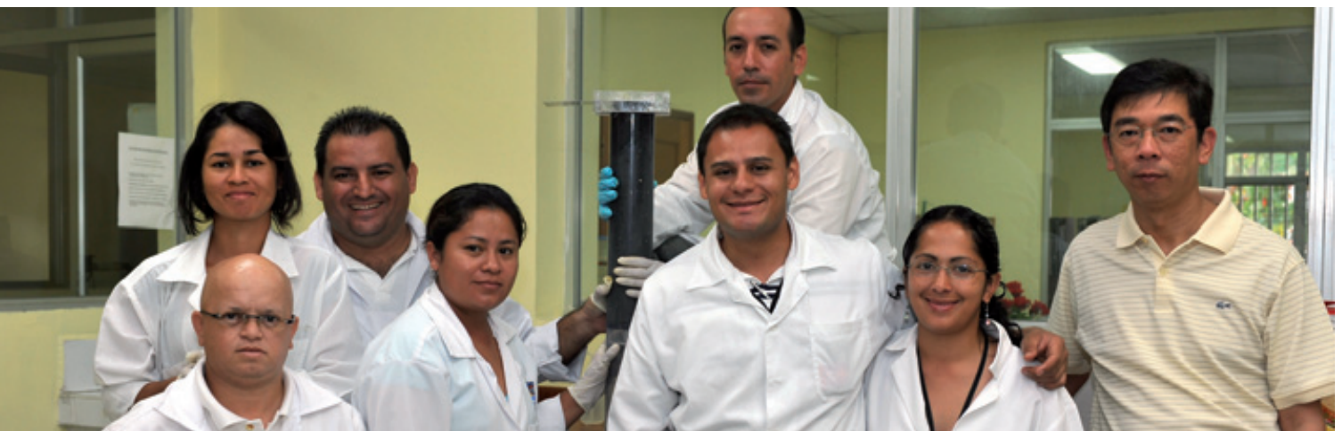
14 Le projet sur la pollution des eaux côtières dans les Caraïbes, RLA/7/012, a mis en place un réseau d'individus talentueux, d'établissements et de laboratoires de la région qui partagent activement informations, ressources et capacités.

En offrant du matériel aux laboratoires des pays des Caraïbes participants, l'AIEA a contribué à améliorer la capacité technique et analytique dans la région en ce qui concerne le recours aux techniques nucléaires pour l'étude de la pollution des eaux côtières.