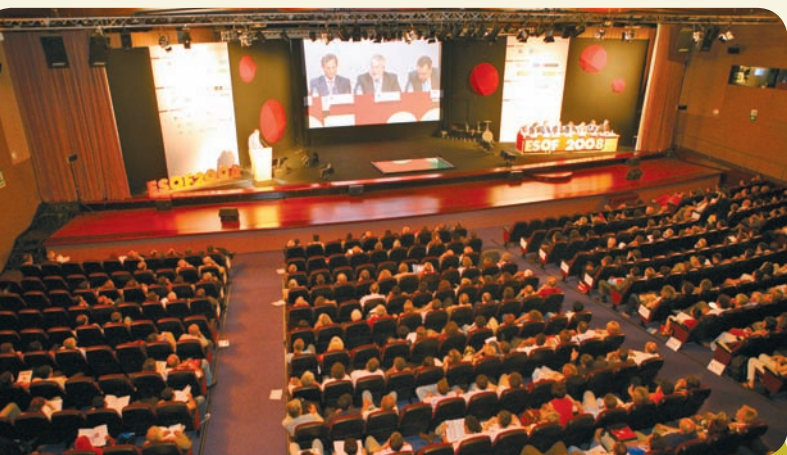
ESOF 2008 a attiré quelque 4000 participants.