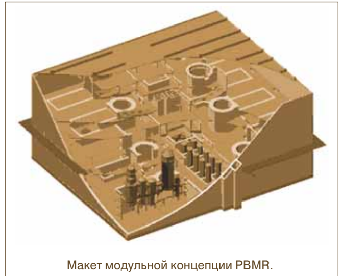
Макет модульной концепции PBMR.

Данная концепция предусматривает введение при необходимости дополнительных модулей, и они могут быть скомпонованы в соответствии с потребностями обслуживаемого населенного пункта или района. Реакторы могут работать изолированно в любом месте при наличии достаточного количества воды для охлаждения. Существует возможность сухого охлаждения, которое, будучи более дорогим, обеспечивает большую свободу в выборе места размещения.