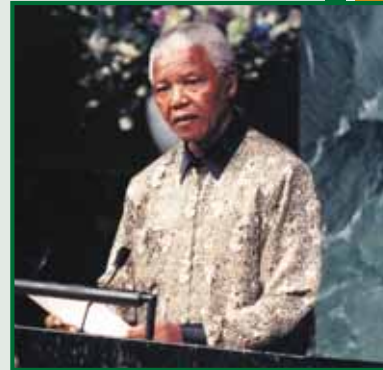
Declaración de Nelson Mandela ante la Asamblea General de las Naciones Unidas

En consonancia con su firme adhesión al desarme y la no proliferación al nivel mundial, Sudáfrica adoptó la decisión en 2002 de adherirse al protocolo adicional, convirtiéndose en uno de los primeros países de África en concertar tal protocolo. En junio de 2002 Sudáfrica patrocinó un seminario regional del OIEA sobre la importancia de los acuerdos de salvaguardias y los protocolos adicionales para la no proliferación, al que asistieron casi 100 personas, incluidos participantes de 36 países africanos. En su discurso de apertura ante esa reunión, la Ministra sudafricana Susan Shabango dijo: "Para que el Organismo pueda cumplir sus responsabilidades debe recibir las facultades correspondientes. Consideramos que todos los Estados africanos deben adherirse a los acuerdos de salvaguardias y los protocolos adicionales." Hasta la fecha, casi un tercio de los Estados de África han atendido a ese llamamiento.