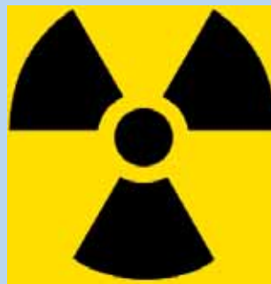
“Símbolo del trébol” para la radiación

El trébol es el símbolo internacional que figura en todos los contenedores, materiales o dispositivos que contienen un componente radiactivo. La palabra “radiactivo” y el número I, II o III también pueden aparecer en el embalaje utilizado para transportar fuentes radiactivas.