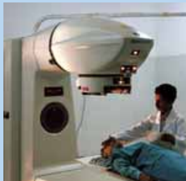
El equipo de teleterapia utiliza fuentes radiactivas potentes para destruir los tumores cancerosos.

No obstante, si estas fuentes se extravían, o son robadas, pueden caer en manos de personas que no tienen