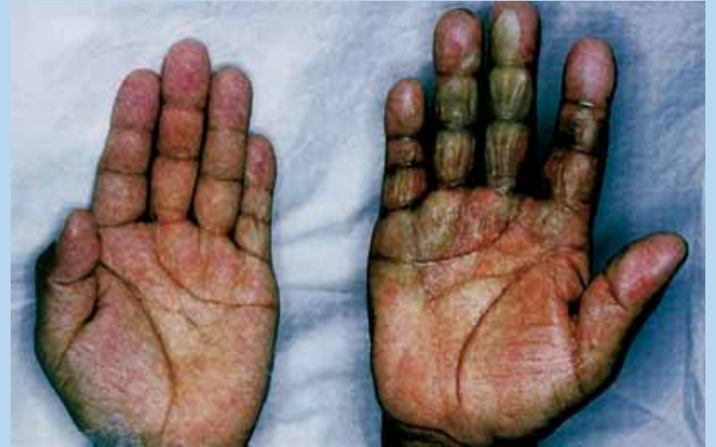
Ampollas en la palma de la mano derecha causadas por radiaciones.

Las radiolesiones pueden parecer quemaduras, pero, a diferencia de éstas, no sanan fácilmente. Las náuseas, la diarrea y la fiebre son otros de los síntomas de exposición a altos niveles de radiación. En caso de sentir estos síntomas tras haber estado cerca de un bulto o un contenedor metálico marcado con el símbolo de la radiactividad, o de haberlo tocado, se deberá consultar a un médico inmediatamente. Deberá informarse al médico sobre cualquier contacto con una fuente radiactiva. Asimismo, deberá tenerse en cuenta que no es necesario tocar una fuente radiactiva para estar expuesto a la radiación.