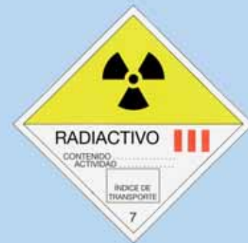
Etiqueta para el transporte de fuentes radiactivas