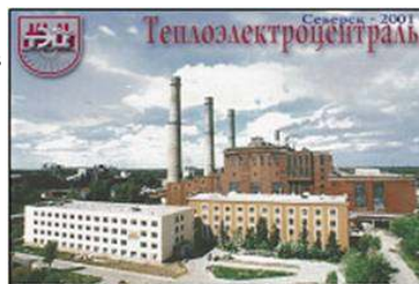
Seversk Fossil Fuel Plant