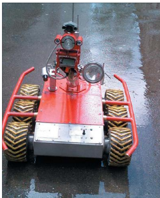
Рис. 3. Малогабаритный робот

В процессе выполнения КИРО все оборудование, которое было запланировано, поставлено. Проведена инвентаризация и определение характеристик ОЯТ, ТРО и ЖРО в местах их хранения. Разработана радиационная карта объекта и акватории. Проведена оценка состояния гражданских сооружений и объектов инфраструктуры, включая состояние оборудования для обращения с ОЯТ и РАО (погрузочно-разгрузочные устройства, переработка ЖРО и проч.). Все данные собраны в электронные файлы с которыми легко работать в дальнейшем, в том числе для использования в проектных работах. Таким образом, подготовлен комплект исходных данных и информации, необходимых для выполнения последующих стадий работы.