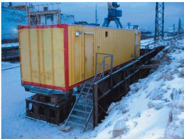
Рис. 2. Мобильный санпропускник рядом со зданием №32